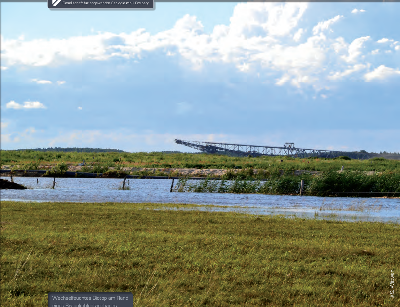
Wechselfeuchtes Biotop am Rand eines Braunkohlentagebaues