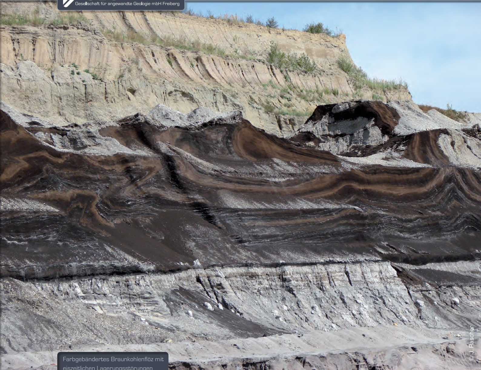
Farbgebändertes Braunkohlenflöz mit eiszeitlichen Lagerungsstörungen