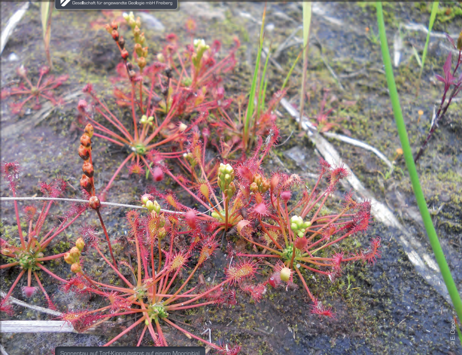
Sonnentau auf Torf-Kippsubstrat auf einem Moorinitial