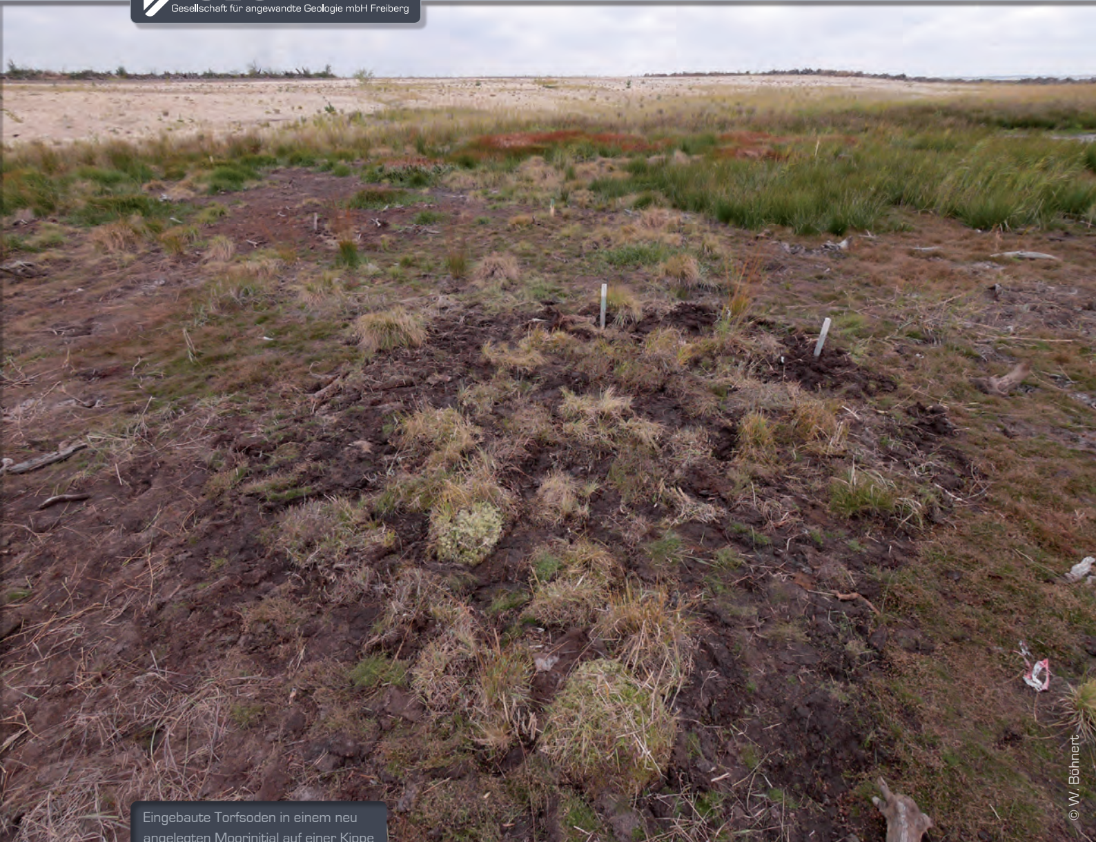
Eingebaute Torfsoden in einem neu angelegten Moorinitial auf einer Kippe