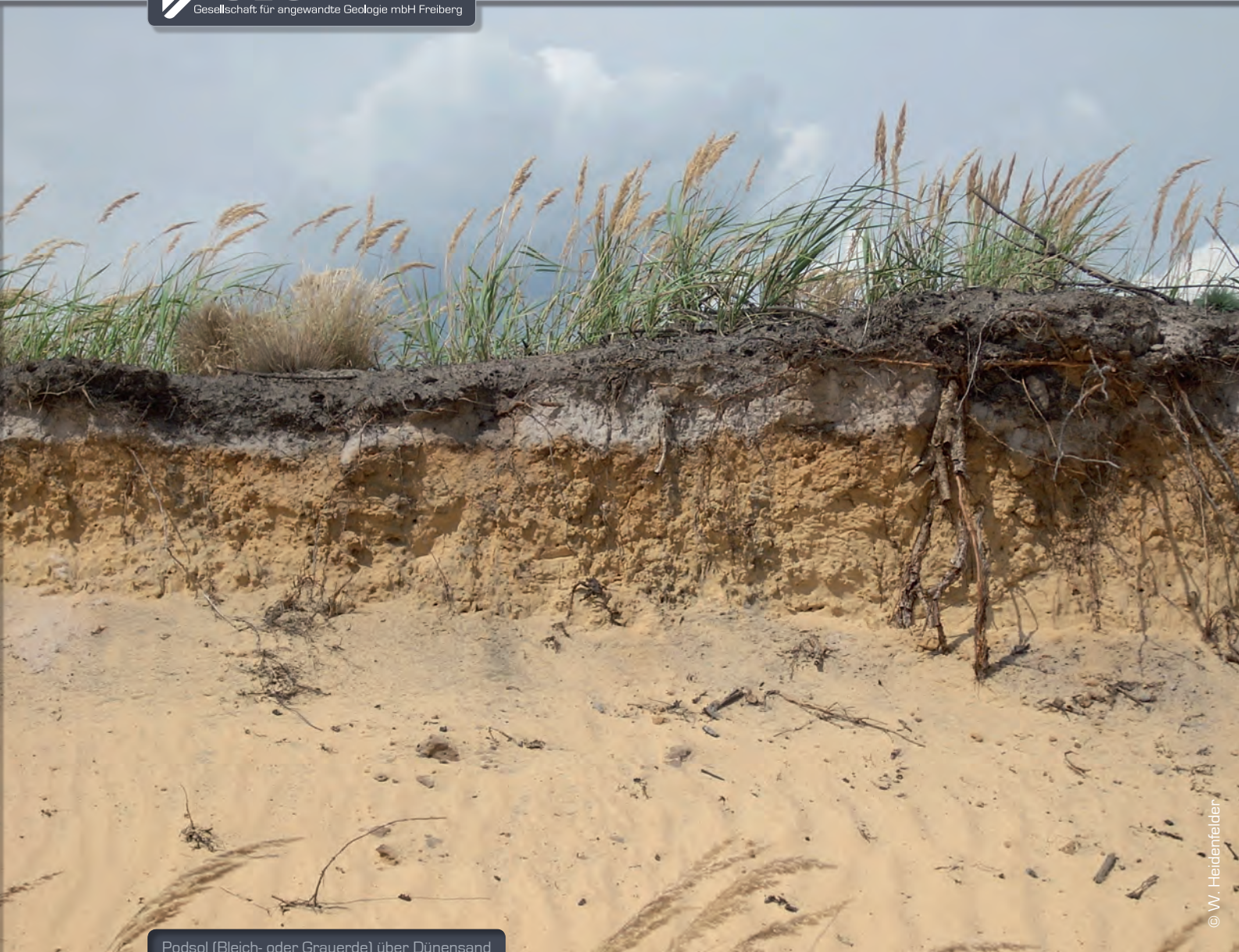
Podsol (Bleich- oder Grauerde) über Dünensand