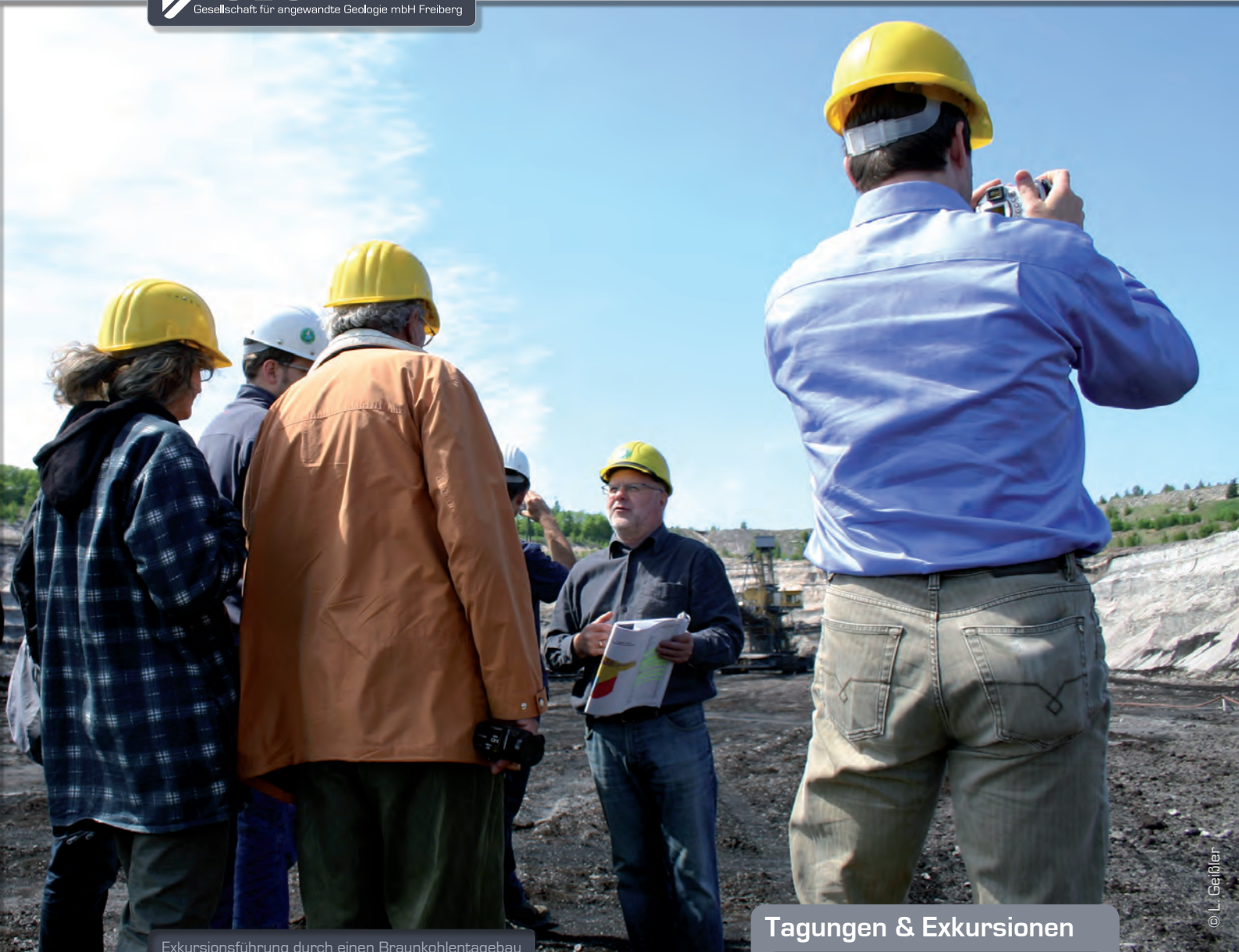
Exkursionsführung durch einen Braunkohlentagebau