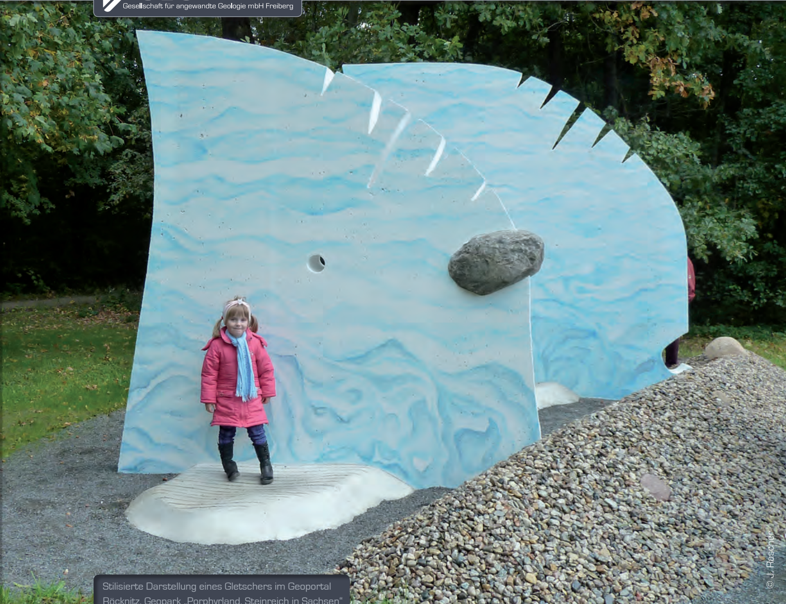
Stilisierte Darstellung eines Gletschers im Geoportal Röcknitz, Geopark „Porphyryland. Steinreich in Sachsen“